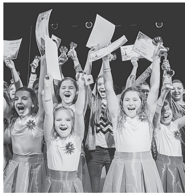
Студия «Вокалист» празднует победу