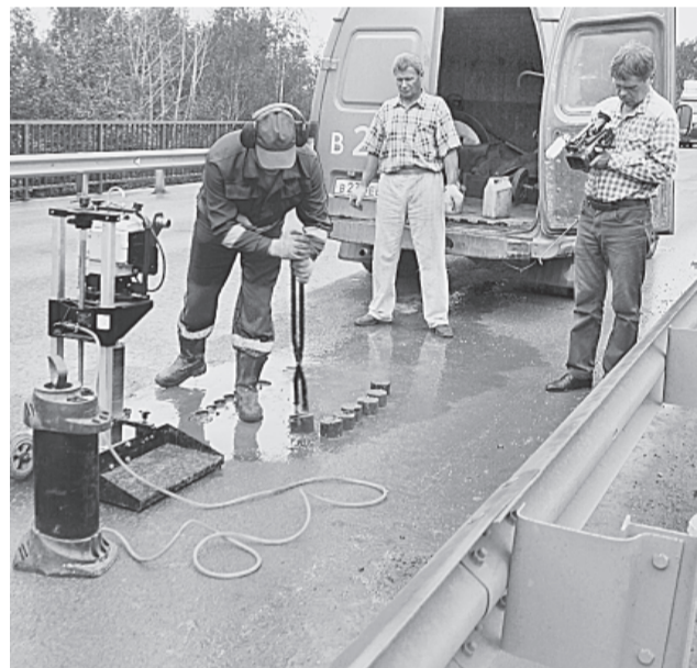
Асфальт на виадуке берут на пробу...

ФКУ «Центр ГИМС МЧС России по Новгородской области».